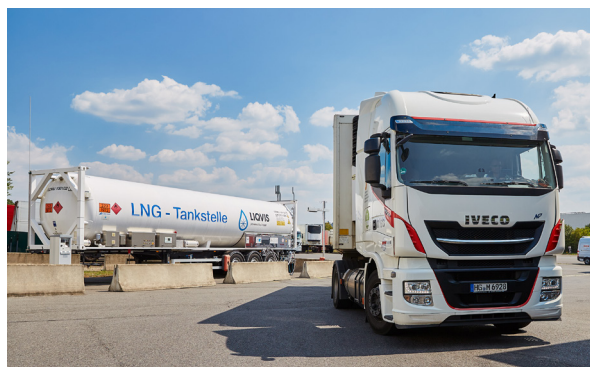
LNG-Tankstelle mit LNG-Truck, Quelle: BDEW/Swen Gottschall